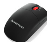
Mouse wireless Lenovo Laser