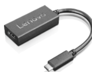
Adattatore da USB-C a HDMI