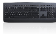
Tastiera wireless Lenovo Professional